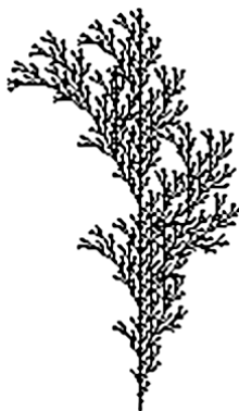
Abbildung 1: Grafische Interpretation eines Lindenmayer-Systems

In diesem Kapitel soll zunächst eine Reihe von Generatoren vorgestellt werden, die aus Zahlen realistische Dinge machen, die die menschlichen Intuition für die Naturgesetze befriedigen.